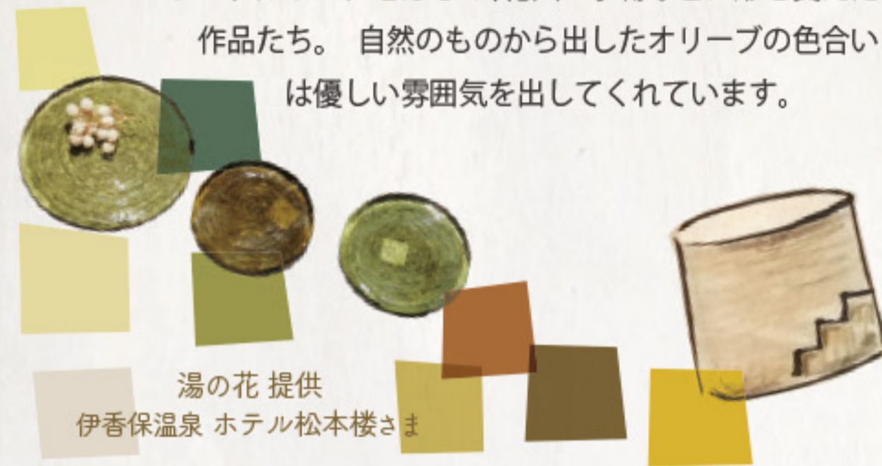
湯の花 提供 伊香保温泉 ホテル松本楼さま

テーブルウェアをはじめ、花入・小物などに形を変えた作品たち。自然のものから出したオリーブの色合いは優しい雰囲気を出してくれています。