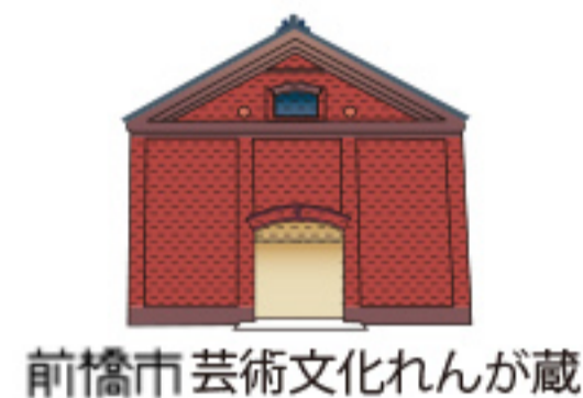
前橋市芸術文化れんが蔵